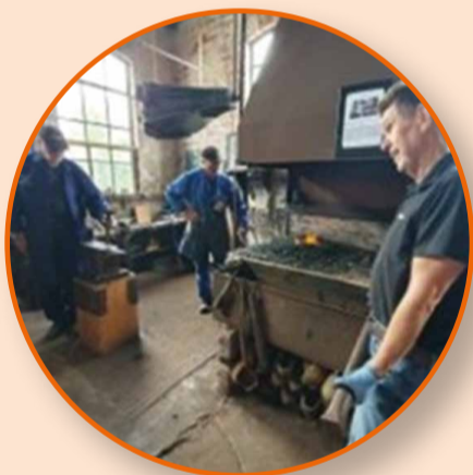
Oude werkplaats voor antieke schepen.