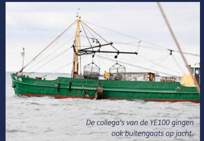
De collega's van de YE100 gingen ook buitengaats op jacht.